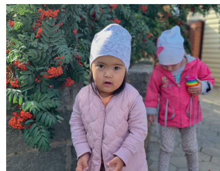
Nos petits accueillis